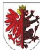
MARSZAŁEK WOJEWÓDZTWA KUJAWSKOPOMORSKIEGO Piotr Całbecki